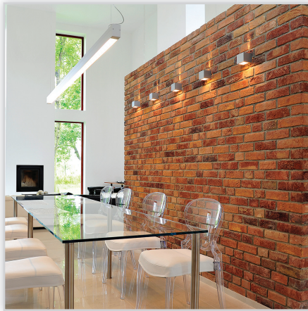
Cegły i płytki ręcznie formowane – 29 Primula. Zastosowanie: elewacje wszelkiego rodzaju budynków, elementy dekoracyjne we wnętrzach, ogrodzenia i mała architektura.