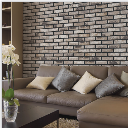
Cegły i płytki ręcznie formowane – 155 Vecto. Zastosowanie: elewacje wszelkiego rodzaju budynków, elementy dekoracyjne we wnętrzach, ogrodzenia i mała architektura.