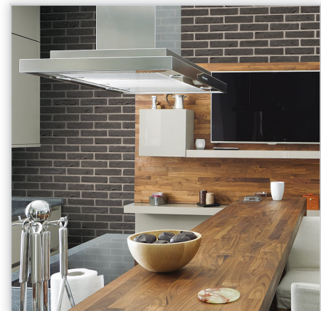
Cegły i płytki ręcznie formowane – 73 Leto. Zastosowanie: elewacje wszelkiego rodzaju budynków, elementy dekoracyjne we wnętrzach, ogrodzenia i mała architektura.