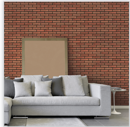
Cegły i płytki ręcznie formowane – 511 Aalborg. Zastosowanie: elewacje wszelkiego rodzaju budynków, elementy dekoracyjne we wnętrzach, ogrodzenia i mała architektura.