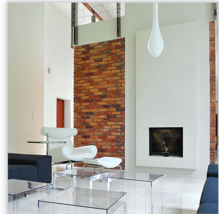
Cegły i płytki ręcznie formowane – 29 Primula. Zastosowanie: elewacje wszelkiego rodzaju budynków, elementy dekoracyjne we wnętrzach, ogrodzenia i mała architektura.