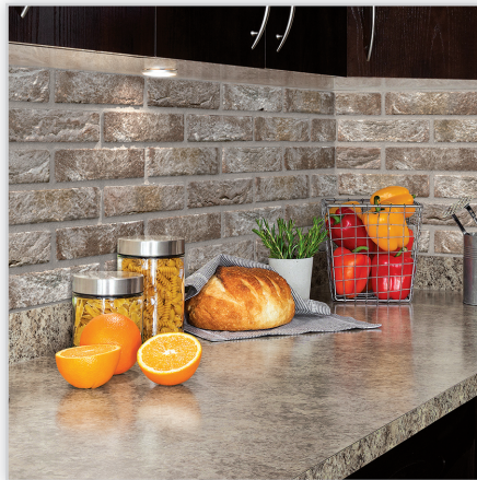
Cegły i płytki ręcznie formowane – 79 Anicius. Zastosowanie: elewacje wszelkiego rodzaju budynków, elementy dekoracyjne we wnętrzach, ogrodzenia i mała architektura.