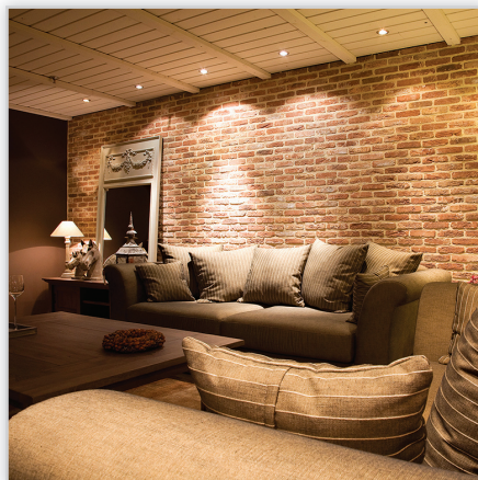
Cegły i płytki ręcznie formowane – 60 Oud Brabant. Zastosowanie: elewacje wszelkiego rodzaju budynków, elementy dekoracyjne we wnętrzach, ogrodzenia i mała architektura.