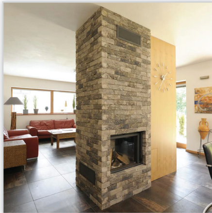
Cegły i płytki ręcznie formowane – 45 Lithium. Zastosowanie: elewacje wszelkiego rodzaju budynków, elementy dekoracyjne we wnętrzach, ogrodzenia i mała architektura.